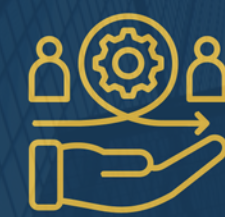
ניהול, מנהיגות ואסטרטגיה